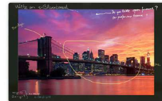
e-Blackboard Compact 86"