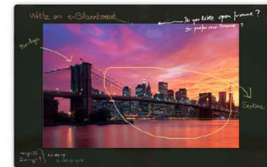
e-Blackboard Compact 75"

Con la misma filosofía y características técnicas nace la versión compacta de esta pizarra: la nueva e-Blackboard Compact. Se trata de un único panel de cristal negro de 2 metros con un display integrado de 75 o 86 pulgadas. El panel es rotulable en su totalidad, incluso en la parte donde se encuentra el display interactivo.